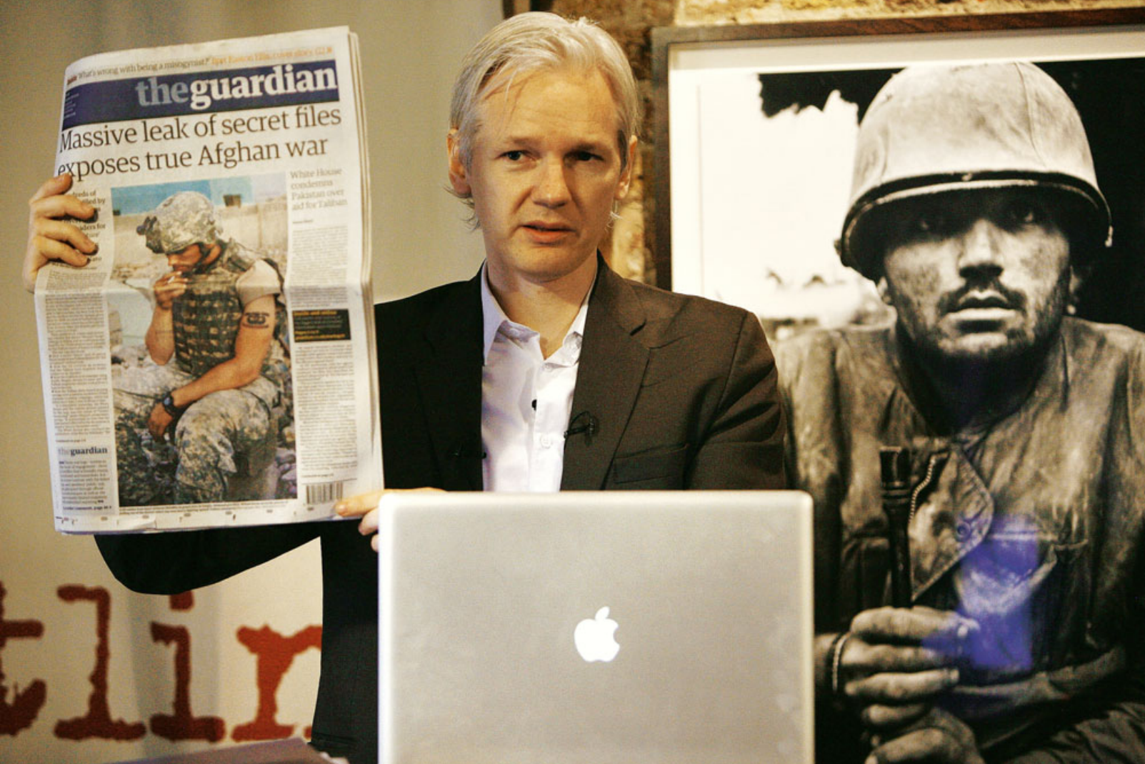
WikiLeaks-Gründer Assange*: „Er hat meinen Vorschlag als Angriff auf seine Rolle gesehen“